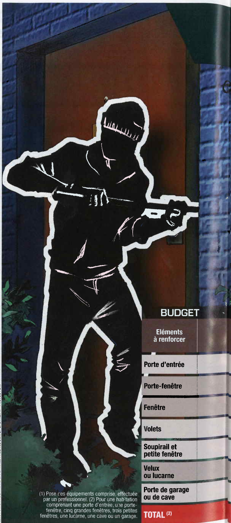
ILLUSTRATION: BERTRANDS CHABANNES / AGENCE L'UN ET L'AUTRE FR